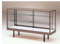
スタンダードケース